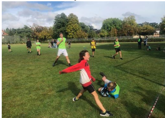
doch es klappt nicht immer