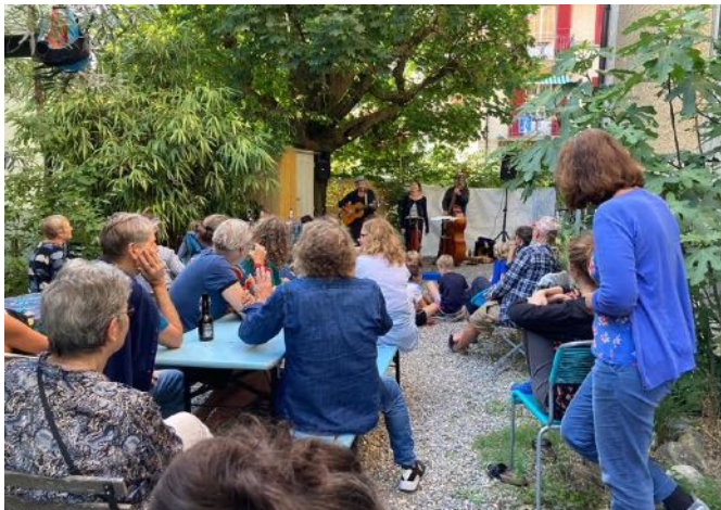
Brückenstrasse 7, Fado mit Colibri im Trio, dazu Bacalhau von Maya