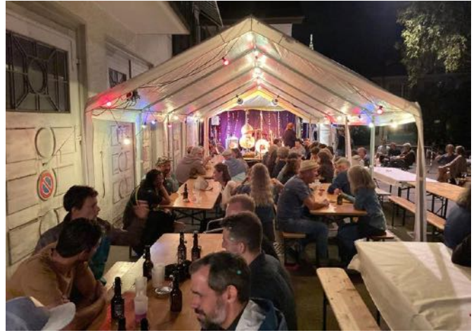
und um 23 Uhr