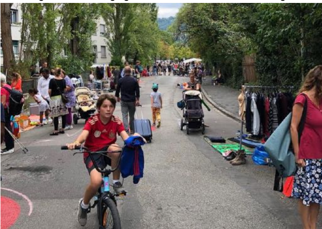
Flohmi-Neuaufgabe in der neuen Begegnungszone