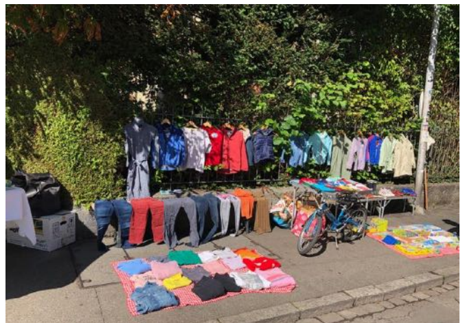
mit reichlich bunten Auslagen