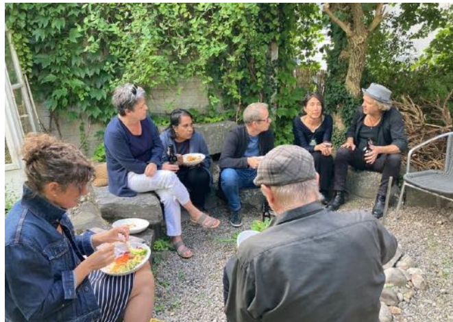
& Mätü und Gespräche mit den Musiker:innen