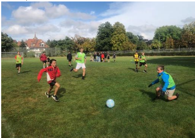
Marzili-Cup mit vollem Einsatz