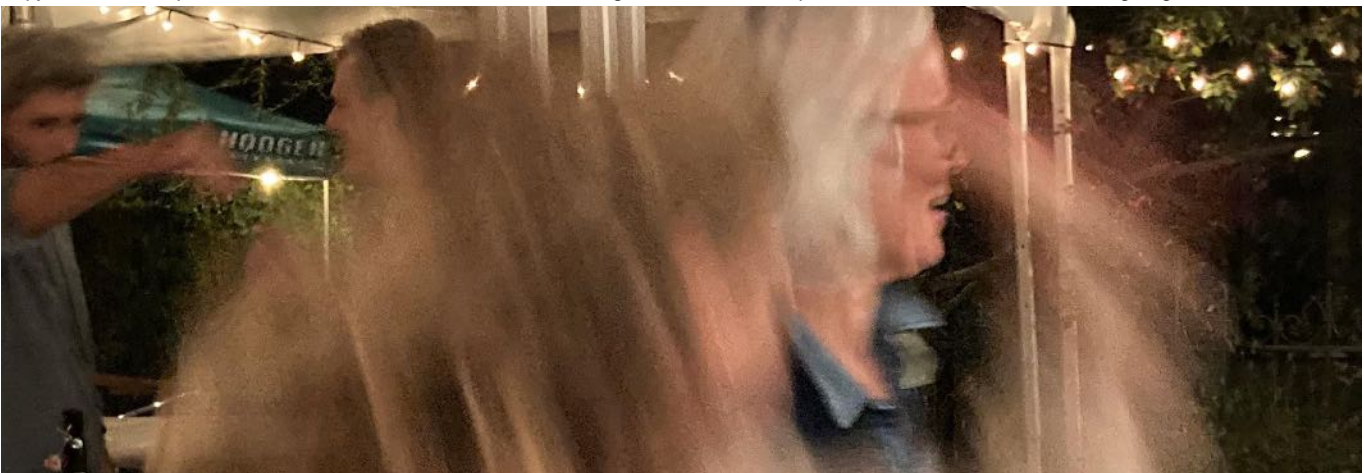
Vom Regen verschont, ging es am Quartierfest ziemlich lustig zu