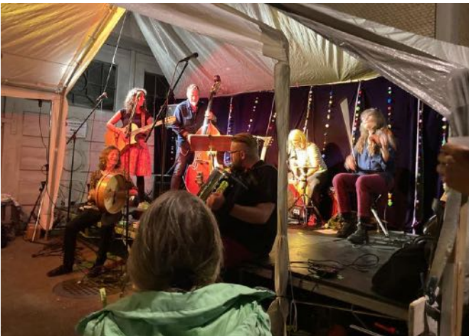
Zapjevala, osteuropäische, französische und schweizerische Klänge