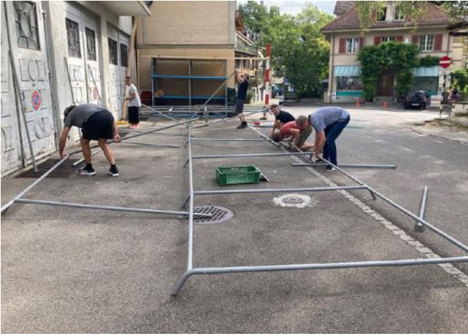
Quartierfest, Festplatz 11 Uhr ...