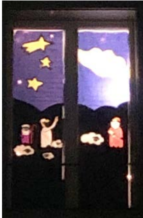
Marzilistrasse 8, Familie Graber

Trinken an einem der nächsten Quartierfeste) ging an die Familie Graber an der Marzilistrasse 8. Der zweite und dritte Platz wurde mit gleichen Punkten an die Fenster an der Marzilistrasse 22d und an der Weihergasse 16 (Seite Münzrain) vergeben.